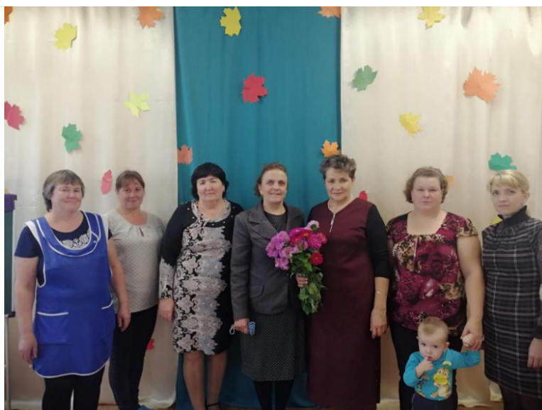
Помним коллег, ушедших на заслуженный отдых